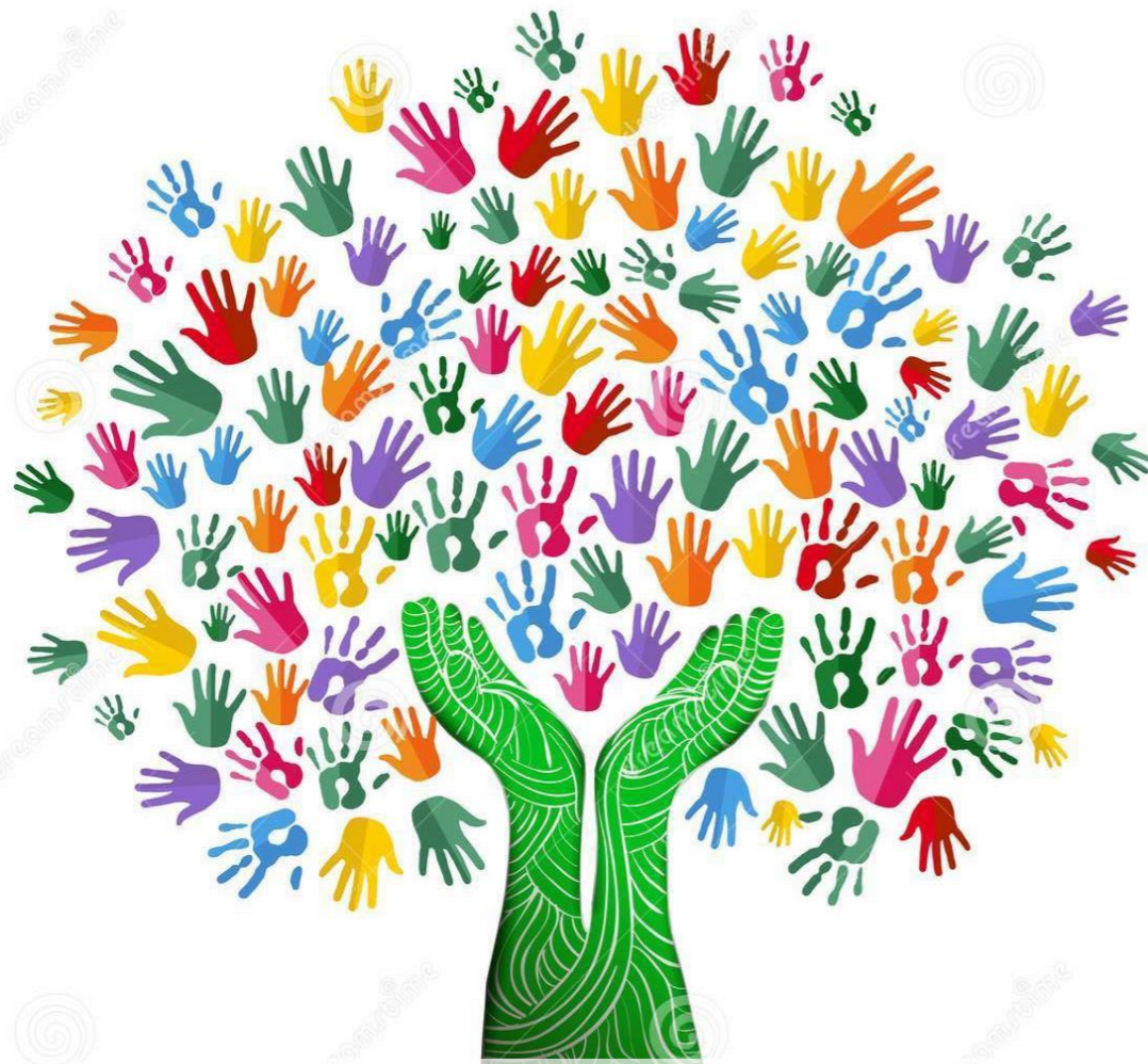
Valeurs partagées par l'équipe éducative

L'arbre, symbole de notre devenir ensemble, illustre donc le projet éducatif de notre école. Il est le fruit d'un travail conjoint des membres de la communauté éducative.